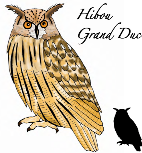
Hibou Grand Duc