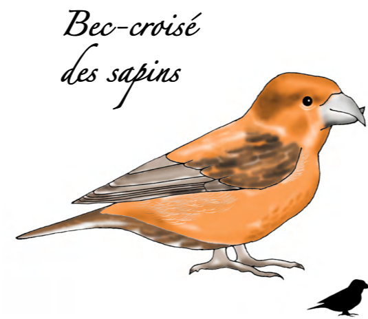
Bec-croisé des sapins