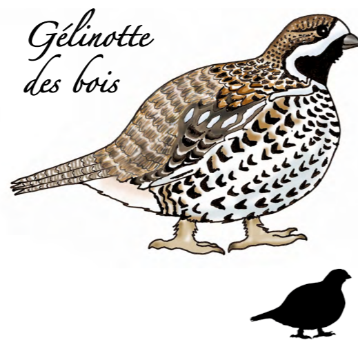
Gélinotte des bois